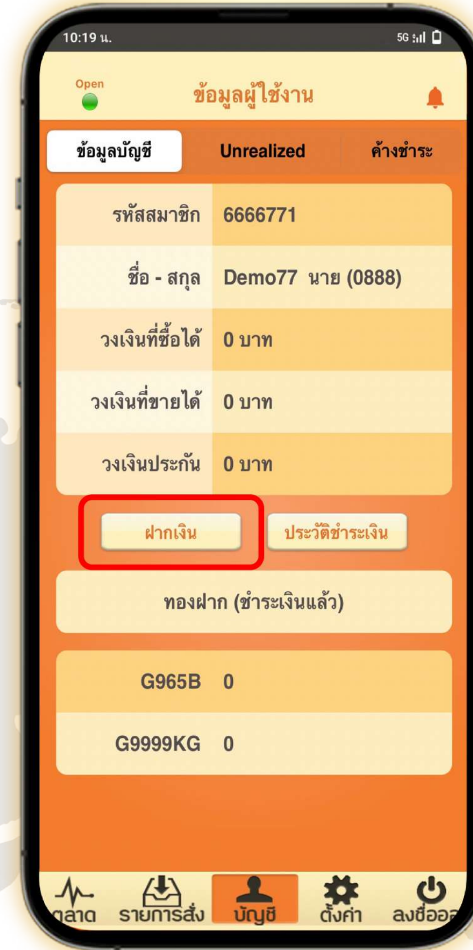
2. เลือก ฝากเงิน