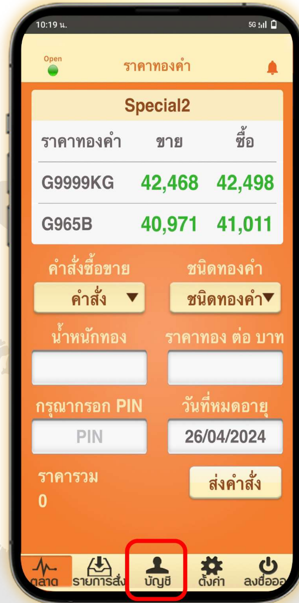
1. หน้าหลัก เลือก บัญชี